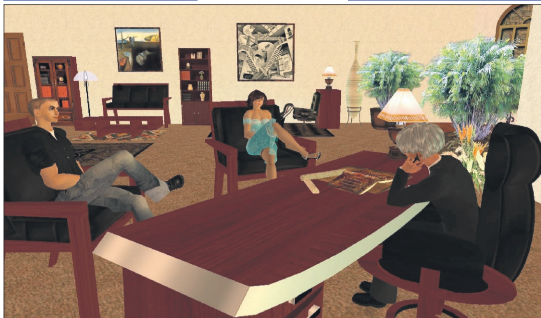
Imatge extreta d'una teràpia psicoanalítica d'EPBCN A Second Life